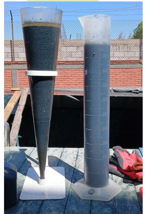
Instalación de sistema Star en Empresa Automotriz