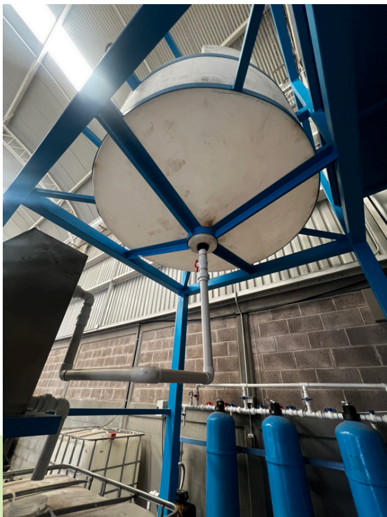
Reutilización de Agua en empresa dedicada a Lavado de envases con solventes