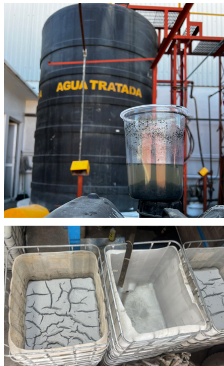
Servicio mensual en Efluente, Empresa Cartonera